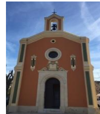
STE MARIE MADELEINE DE LA MOLE

Contact PRESBYTERE : 3 Place Étienne Dolet - 83310 Cogolin Téléphone : 04 94 54 64 23 Email : paroisse.cogolin@gmail.com