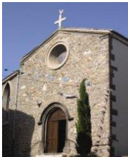
SAINT SAUVEUR DE COGOLIN https://cogolin.frejustoulon.fr/

« La Sagesse se laisse trouver par ceux qui la cherchent. » « Dieu, tu es mon Dieu, je te cherche dès l'aube : mon âme a soif de toi ; après toi languit ma chair, terre aride, altérée, sans eau » « Veillez donc, car vous ne savez ni le jour ni l'heure. »