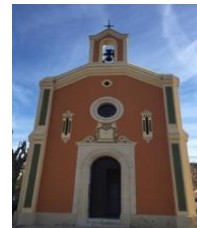
STE MARIE MADELEINE DE LA MOLE https://lamole.frejustoulon.fr/

Intention du Pape pour Novembre: Pour le Pape. Prions pour le Pape, afin que, dans l'exercice de sa mission, il continue à accompagner dans la foi le troupeau qui lui est confié, avec l'aide de l'Esprit Saint.