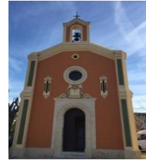
STE MARIE MADELEINE DE LA MOLE